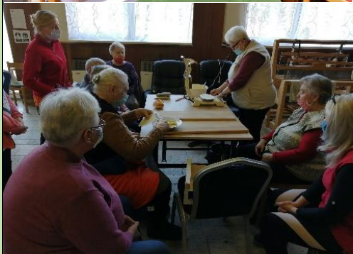
Pečenie vianočných oblátok pre občanov obce