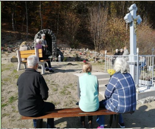
Púť k novovysvetenej kaplnke pri Krosnej