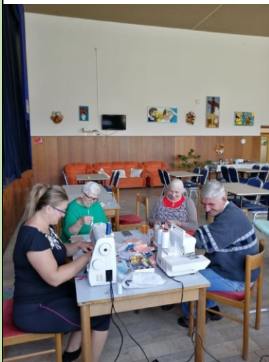
Šitie rúšok pre občanov obce