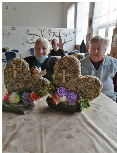
Tvorba dušičkových dekorácií