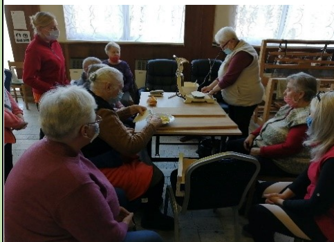
Pečenie vianočných oblátok pre občanov obce