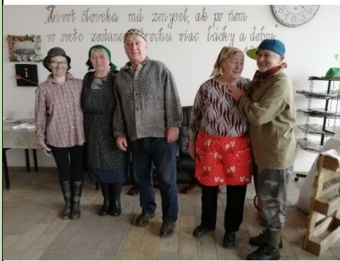
Fašiangové divadielko o tom, ako Koškovčania zabíjačku robili - február 2020