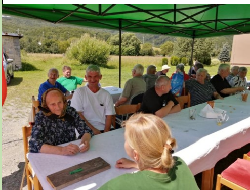
opekačka na turičný pondelok